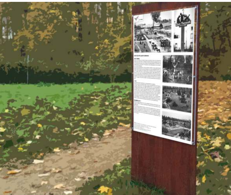
Infotafeln mit historischen Fotos werden an die Geschichte des Areals erinnern.

Ziel der Umgestaltung des Areals am Alten Tierpark ist die Wiederbelebung des Geländes unter gesellschaftlichen und ökologischen Gesichtspunkten. Der Park soll wieder ein Treffpunkt für die Süchtelnerinnen und Süchtelner werden.