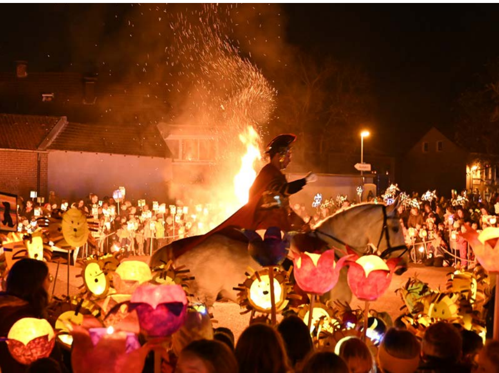
Viele leuchtende Kinderaugen beim Ritt um das Martinsfeuer