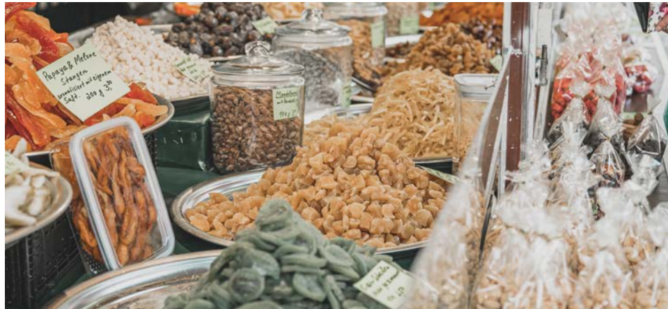
Bunte Vielfalt auf dem Süchtelner Weihnachtsmarkt

Angebot des Weihnachtsmarktes umfasst unter anderem Bastelmöglichkeiten, einen Weihnachtsbasar im Weberhaus, musikalische Darbietungen wie einen Posaunenchor, Aufführungen des Metropol Theaters sowie Ausstellungen im Heimatmuseum und im SüchtelnBüro. Am Samstag und Sonntag kommt der Nikolaus zu Besuch und verteilt Kleinigkeiten an die Kinder. Der MärchenWeihnachtsmarkt in Süchteln wird organisiert vom Citymanagement der Stadt Viersen in Kooperation mit Viersen aktiv. Sponsoren sind die Viersener Sparkassenstiftung, die Volksbank sowie Ivangs Bedachungen.