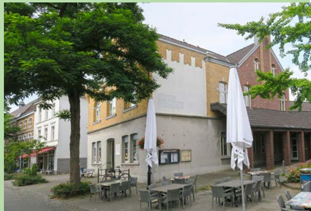
Weber- und Tendyckhaus

Der Rat der Stadt hat deshalb die Verwaltung mit der Ausarbeitung der vorgestellten Vorentwurfsplanung und der Antragstellung für die benötigten Fördermittel für 2023 beauftragt.