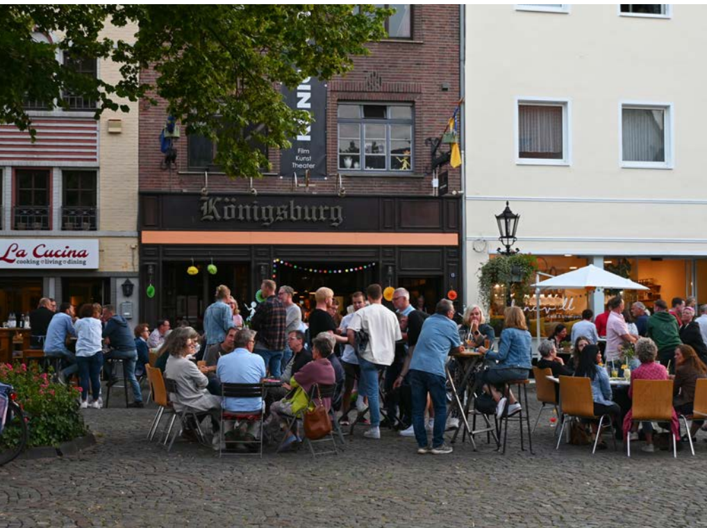
Süchteln gesellig: Cocktail-Abend mit Livemusik an der Königsburg