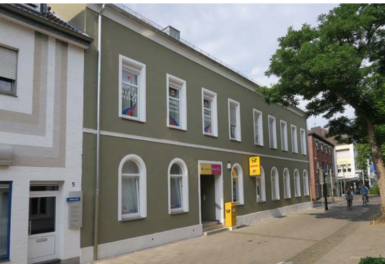
Das Postgebäude an der Tönisvorster Straße

Das schöne Süchtelner Stadtbild hat ein Hingucker mehr: Am östlichen Stadteingang erstrahlt das große historische Gebäude mit der Postfiliale und dem Pflegedienst in neuem Glanz. Eine aufwendige Sanierung der Fassade mit Förderung des Hof- und Fassadenprogramms macht das städtebaulich wichtige Gebäude zu einem weiteren Baustein einer attraktiveren Stadtgestal-